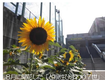
8月に開花した「と根性のまわり7世」

真心こもる「言葉遣い」と、温かな「振る舞い」を心がけよう。“自分さえよければいい”という心は、結局、自分自身をダメにします。人を大切にする分、自分が豊かになり、成長してく。平凡でもいい。「あの人の傍にいと安心する。」「あの人の話を聞くと勇気がでる。」と言われるような、思いやりのある人に成長していこう!