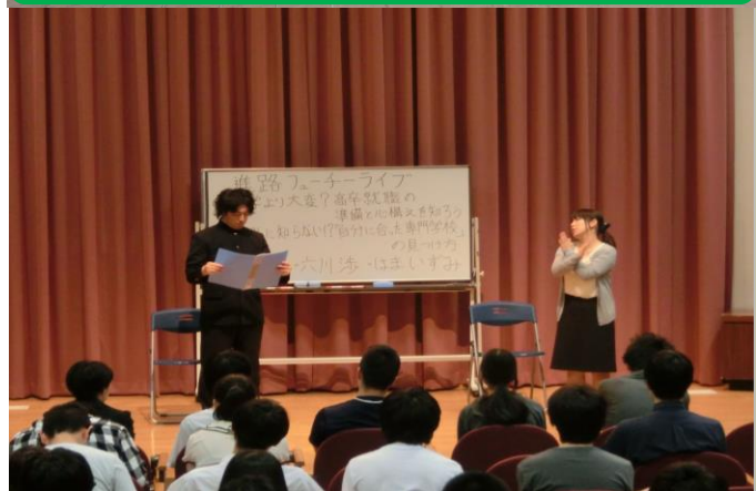
キャリア教育に向けて