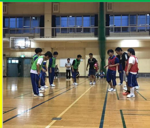
球技大会くサッカーの様子