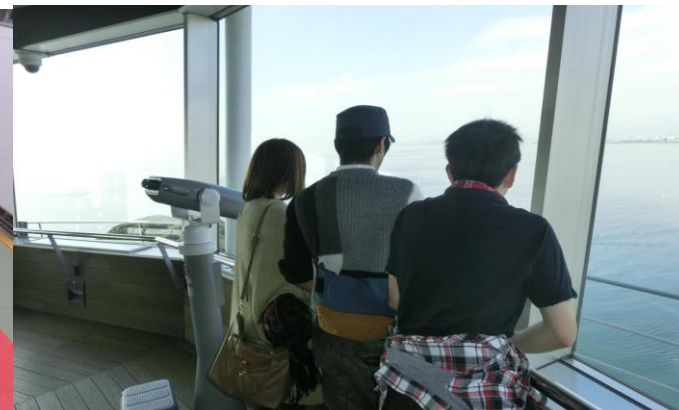
遠足 江の島【全学年合同】