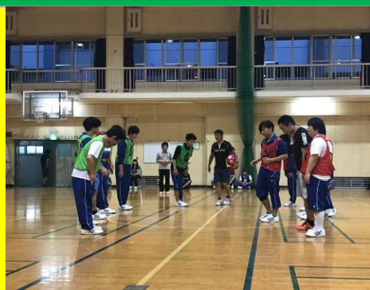
球技大会（サッカー）の様子