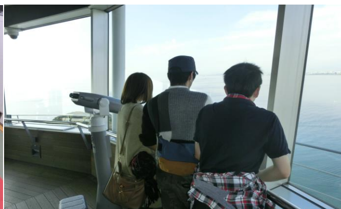
遠足 江の島【全学年合同】