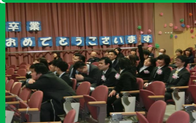
卒業 おめでとうございます