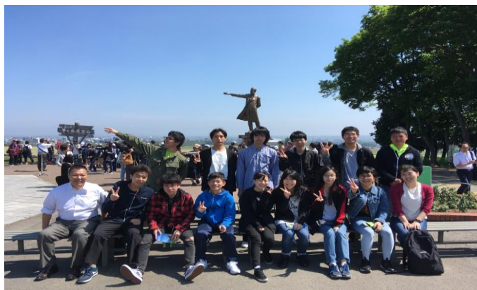
修学旅行 羊ヶ丘展望台にて

生徒は愛情をこめて本校を「サキテイ」（崎定）と言います。 少人数でアットホーム、ゆっくりと学べる学校です。生徒一人ひとりを大切に応援していきます。