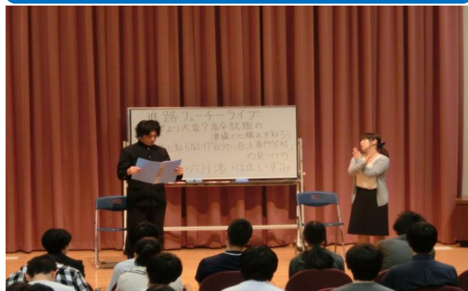
キャリア教育に向けて